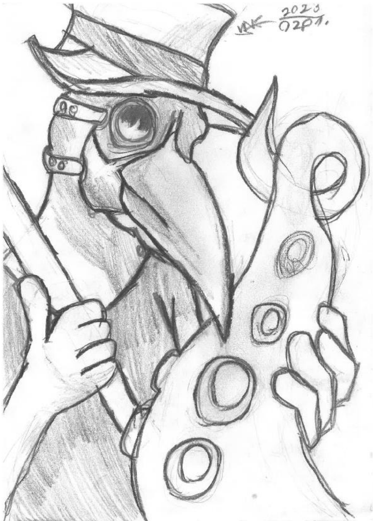
Készítette: Vajda Noel 6.a